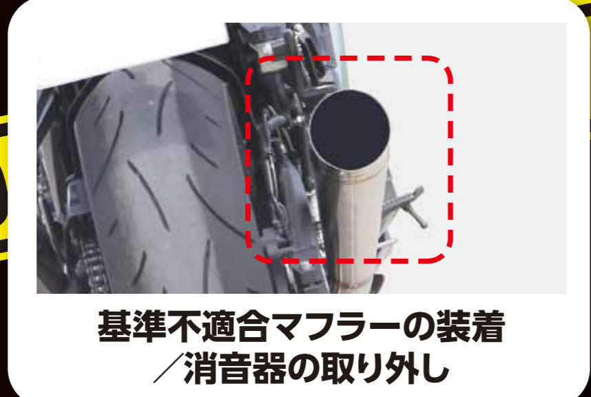
基準不適合マフラーの装着 消音器の取り外し