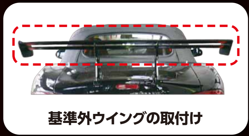
基準外ウイングの取付け