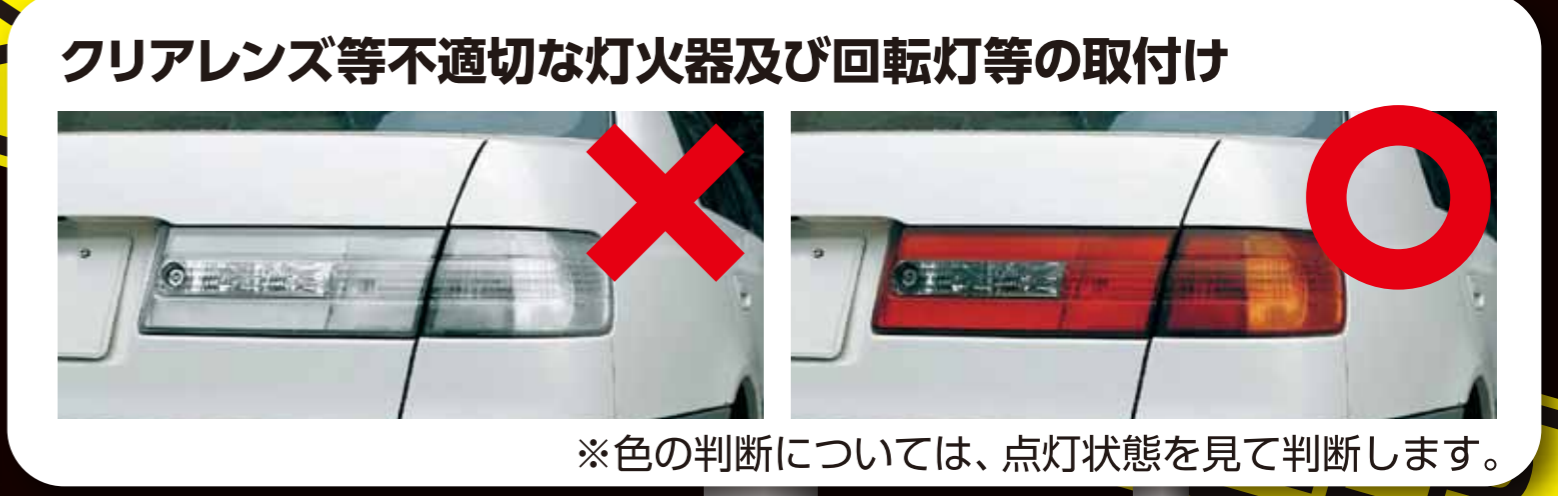
クリアレンズ等不適切な灯火器及び回転灯等の取付け