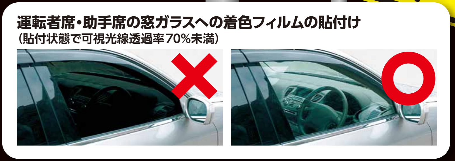
運転者席・助手席の窓ガラスへの着色フィルムの貼付け (貼付状態で可視光線透過率70%未満)